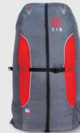
Bolero 7 4.75 kg (S Size)