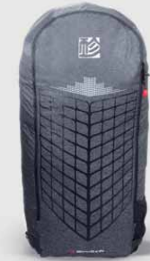
Bolero 7 4.75 kg (S Size)