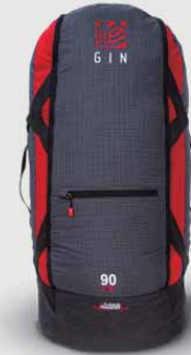
Bolero 7 4.75 kg (S Size)